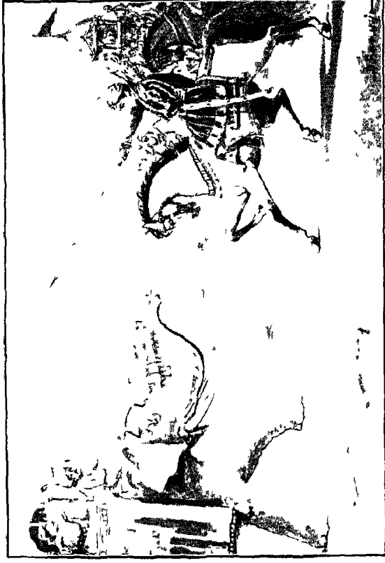
“ श्रीपाल का अपने चाचा अजितसेन से युद्ध ” — पृ० सं० १२६